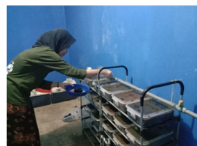
Gambar 8. Penambahan Media Bahan

Penambahan media dilakukan setiap hari dengan kompos tanaman sebagai media bahan yang digunakan sebanyak masing-masing 50 gram pada setiap perlakuan (Gambar 8).