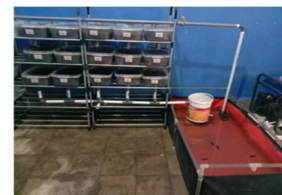
Gambar 3. Wadah Pemeliharaan

Wadah pemeliharaan cacing sutra menggunakan nampan plastik ukuran (25×20×10) cm dengan model rak bertingkat. Tempat penampungan menggunakan terpal yang dibuat membentuk persegi panjang dengan ukuran (100×50×25) cm (Gambar 3).