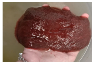
Gambar 7. Cacing Sutra

Cacing sutra didapatkan dari pembudidaya cacing sutra di Desa Cindai Alus dan Kelurahan Landasan Ulin. Cacing sutra dimasukkan ke dalam wadah sebanyak 20 gram setiap perlakuan sebagai bobot awal biomassa cacing sutra (Gambar 7).