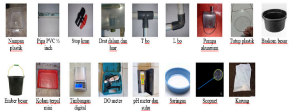
Gambar 1. Alat yang Digunakan

Alat-alat dan bahan-bahan yang digunakan dalam penelitian (Gambar 1 dan Gambar 2).