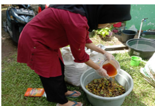
Gambar 5. Pengolahan Kompos

Tanaman air yang akan digunakan sebagai media bahan berasal dari kolam petani ikan di Kelurahan Mentaos. Potongan tanaman yang sudah halus diberi EM4 probiotik untuk tanah yang sudah dicampur dengan air dengan perbandingan 1: 10. Setelah 3 minggu, kompos siap untuk dipergunakan (Gambar 5).