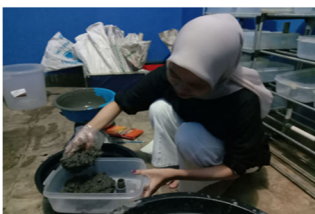
Gambar 6. Media Bahan Budidaya

Lumpur halus yang telah diperoleh dari proses penyaringan dimasukkan ke dalam ember sebanyak 1 kg. Hasil kompos dari media bahan tanaman air yang sudah jadi dimasukkan sebanyak 1 kg ke dalam ember yang berisi lumpur halus dan diaduk sampai tercampur rata. Media bahan yang sudah tercampur merata dimasukkan ke dalam nampan plastik dan dialiri air secara perlahan hingga media terendam dan tergenang seluruhnya kemudian didiamkan selama 3 hari (Gambar 6).