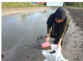
Gambar 4. Pengambilan Lumpur

dikumpulkan dalam wadah berupa ember (Gambar 4).