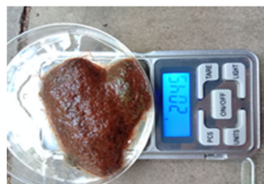
Gambar 9. Pemanenan Cacing Sutra

Pemanenan cacing sutra dilakukan setelah 20 hari pemeliharaan, yaitu pada hari ke 21. Menimbang cacing sutra sebanyak 10 gram dan masukan kedalam plastik klip untuk pengiriman sampel ke Laboratorium (Gambar 9).