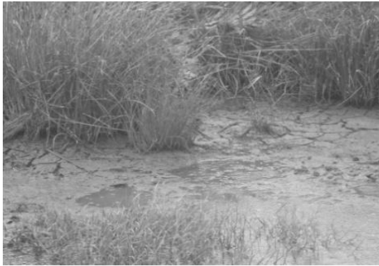
Gambar 5. Vegetasi rumput di daerah lahan alih fungsi sebagai tambak ikan disekitar sarang ikan timpakul