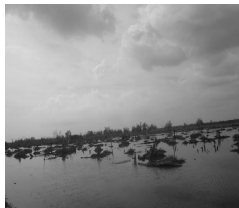
Gambar 4. Habitat P. schlosseri yang sudah dialih fungsikan menjadi