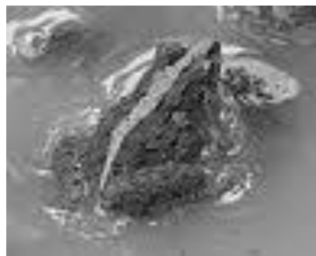
Gambar 10. Anak katak dan anak ikan sebagai sumber pakan P. schlosseri di lahan alih fungsi sebagai tambak ikan