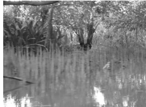
Gambar 4. Vegetasi di lahan yang masih alami, pada lantai penuh dengan akar nafas tumbuhan rawa