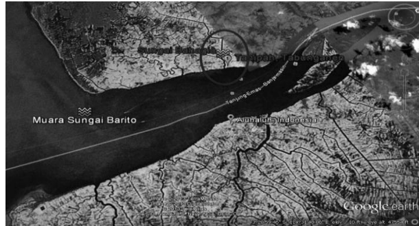
Gambar 1. Peta lokasi pengambilan sampel Timpakul ( P. schlosseri )

dan pengamatan juga dilakukan pada lahan yang sudah dibuka untuk dialihfungsinya sebagai tambak ikan dengan jalan darat. P. schlosseri yang ditemui dicatat, tipe-tipe habitat dan profil dari habitat seperti jenis vegetasi, kemampuan sinar matahari menembus lantai mangrove, keadaan pasang surut air, keadaan penggunaan lahan.