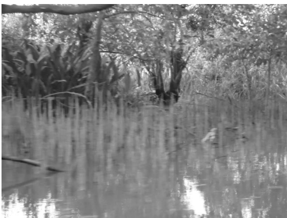
Gambar 3. Habitat P. schlosseri yang masih alami