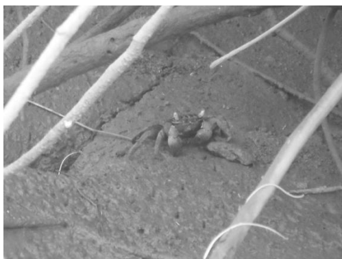
Gambar 9. Kepiting sebagai sumber pakan P. schlosseri di wilayah dekat sungai