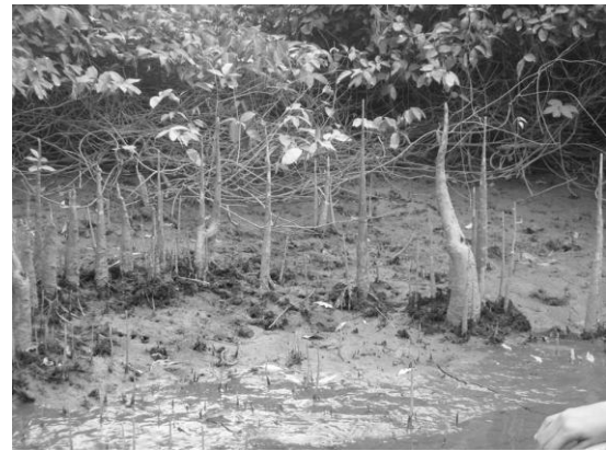
Gambar 8. Habitat yang ternaungi vegetasi mangrove