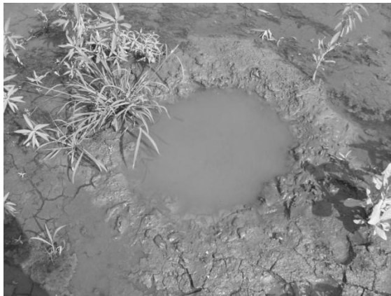
Gambar 7. Lokasi sarang yang terdedah sinar matahari