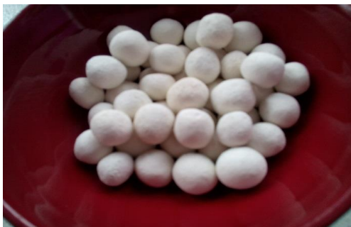
Gambar 1 Sampel hidroton

Berdasarkan hasil uji korelasi, persentase penambahan cocopeat dan nilai bulk density memiliki nilai koefisien korelasi (R)