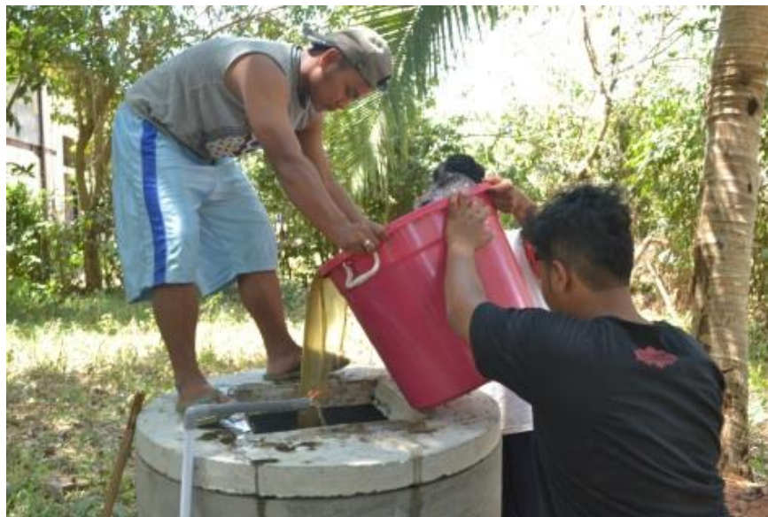
Gambar 5. Penuangan stater biogas