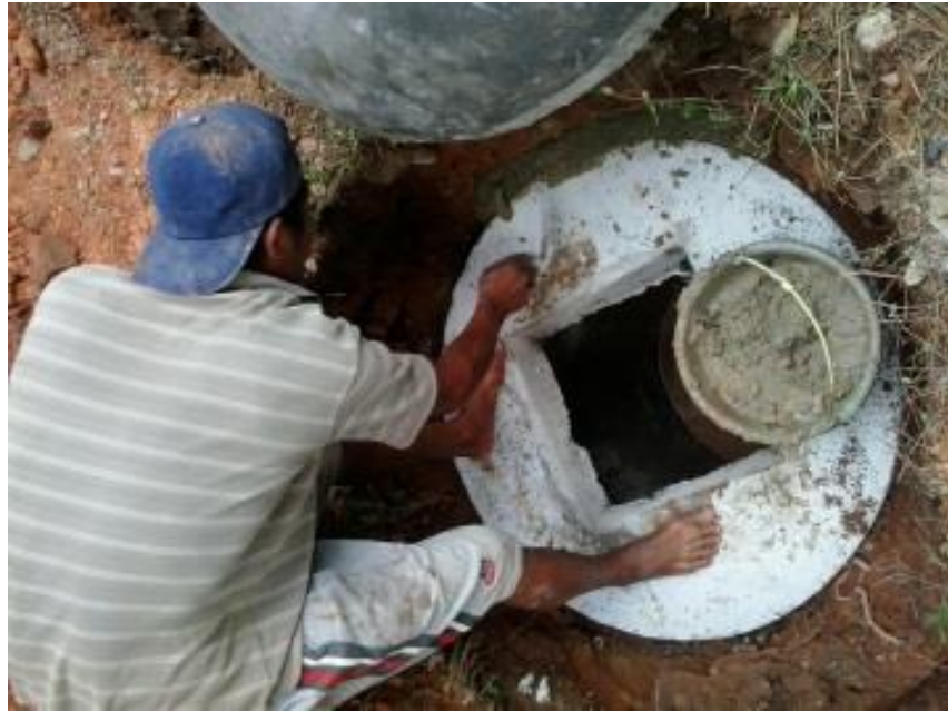
Gambar 4. Pemasangan Tutup lubang penampungan dan serapan