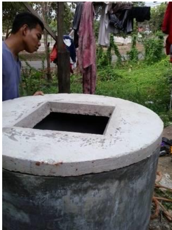
Gambar 3. Pemasangan Tutup Pengolahan sampah organik