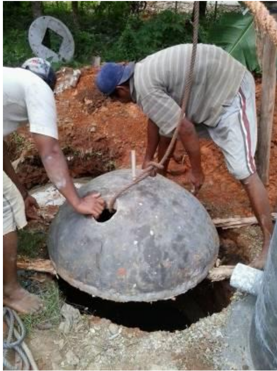
Gambar 2. Pemasangan tutup digester