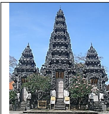
Gambar 10. Kori agung

suci ( bale kulkul ) dan bangunan untuk upacara ritual ( bale gede ) yang terdapat dalam areal balai warga suatu permukiman adat Bali ( bale banjar ). Pada bangunan rumah tradisional Bali, ornamen murdha juga dipahatkan di puncak bangunan bale dauh , yaitu bangunan yang masih memiliki kaitan dengan kegiatan agama atau untuk orang tua dari pasangan muda (suami-istri) pemilik rumah. Berdasarkan uraian tentang bangunan-bangunan “pemakai” di atas, mudah dipahami bahwa ornamen murdha ini pada intinya memiliki korelasi yang kuat dengan fungsi bangunan sebagai bangunan keagamaan atau sebagai bangunan yang diperuntukkan kepada orang-orang yang dituakan dalam suatu keluarga.