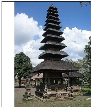
Gambar 16. Arsitektur meru

berupa kekuatan, kesejahteraan, maupun kemakmuran yang berasal dari Tuhan (alam atas/sorga) kepada umat manusia di bumi (alam bawah/dunia). Energi-energi positif Tuhan ini selanjutnya ditampung dalam sebuah wadah untuk kemudian disalurkan kepada umat manusia di bumi. Wadah penampung tersebut selanjutnya diwujudkan sebagai pahatan ornamen murdha berbentuk vas atau jambangan air suci ( tirtha ) (lihat gambar 18).