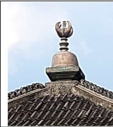
Gambar 8. Murdha berbentuk genta