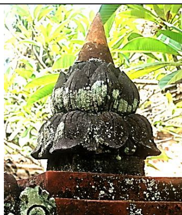
Gambar 20. Murdha berbentuk bunga teratai