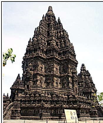
Gambar 13. Candi Prambanan

Kalaśa adalah ornamen puncak bangunan suci Buddhis yang bernama stūpa . Ornamen ini lazimnya berbentuk pahatan permata berkilauan. Kalaśa memuat konsepsi tentang kekosongan atau sunyata yang dikenal dalam ajaran Agama Buddha sebagai nirwana atau nirvāṇa (Stratton, 2002: 18). Alam nirvāṇa dimaknai juga dalam ajaran Buddha sebagai kebalikan dari alam fana atau alam dunia tempat hidup manusia. Nirvāṇa dalam konsepsi Buddha disebut juga sebagai sūnyata . Sūnyata merupakan titik tertinggi dalam ajaran agama Buddha, saat jiwa manusia telah mampu terbebas penuh dari ikatan duniawi dan mampu bersatu dengan Sang Penciptanya ( cf. Christian, 1972: 129).