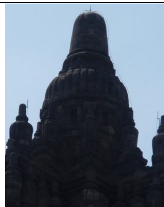
Gambar 14. Rātna pada puncak Candi Prambanan