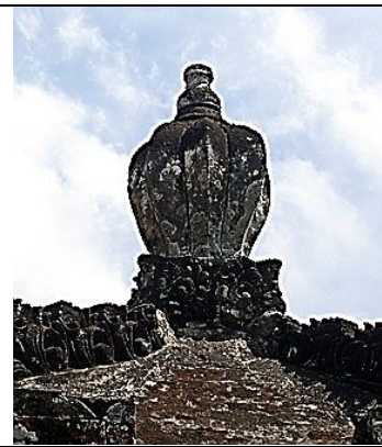
Gambar 18. Murdha berbentuk jambangan