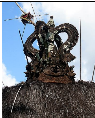
Gambar 17. Murdha dengan elemen lengkung