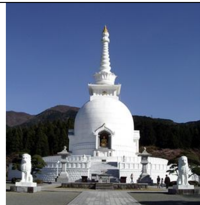
Gambar 15. Stūpa