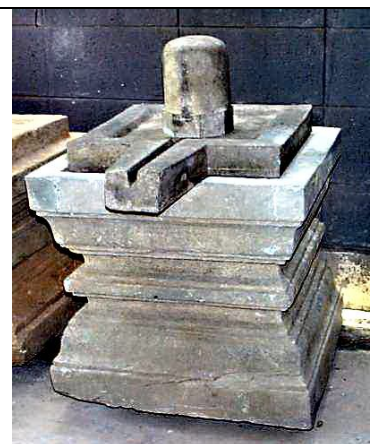
Gambar 21. Lingga-yoni

Konsepsi ini pula menjadi dasar adanya ornamen murdha yang mengambil bentuk dasar lingga-yoni (lihat gambar 7).