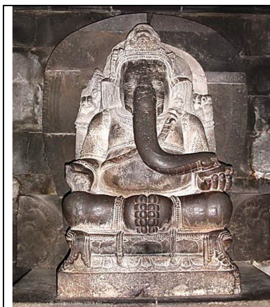
Gambar 19. Arca dewa di atas bunga teratai