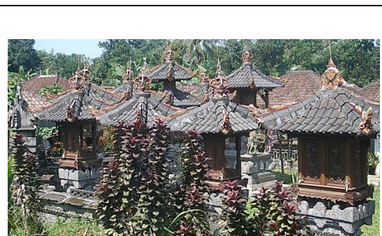
Gambar 12. Bangunan-bangunan suci berpuncak murdha