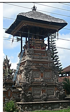
Gambar 11. Bale kulkul