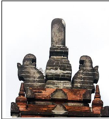
Gambar 7. Murdha berbentuk lingga-yoni