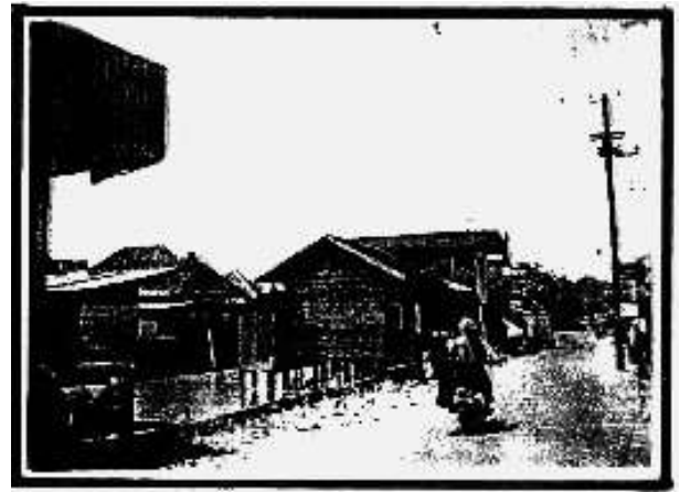
Gambar 5 Sungai sebagai ruang terbuka kota yang miskin vegetasi.