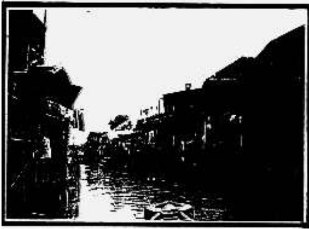
Gambar 3. Perkembangan bangunan yang berakibat mempersempit sungai.