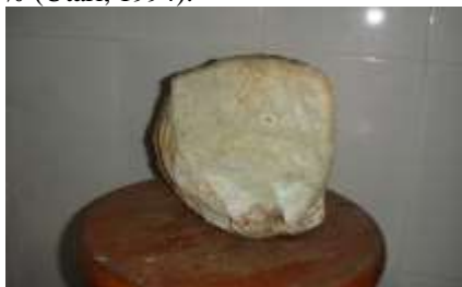
Gambar 1. Kaolin

kelompok kaolin adalah kaolinat, nakrit, dan haloisit dengan mineral utamanya kaolinat, seringkali oksida-oksida seperti \text{Fe}_2\text{O}_3 , \text{TiO}_2 , \text{CaO} , \text{MgO} , \text{K}_2\text{O} dan \text{Na}_2\text{O} terdapat dalam kaolin sebagai zat pengotor. Komposisi kaolin murni adalah \text{SiO}_2 46,54% \text{Al}_2\text{O}_3 39,5% dan \text{H}_2\text{O} 13,96% (Utari, 1994).