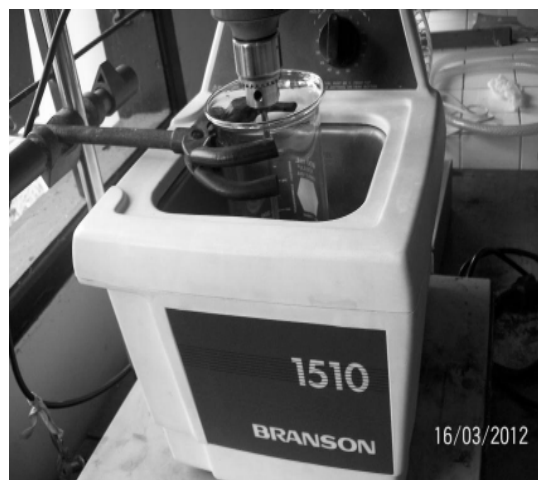
Gambar 1. Ultrasonic bath untuk proses deasetilasi

berbagai variasi waktu (10-30 menit). Kitosan yang dihasilkan dicuci hingga netral dan dikeringkan kemudian dianalisis derajat deasetilasinya dengan alat Fourier Transform Infra Red (FTIR).