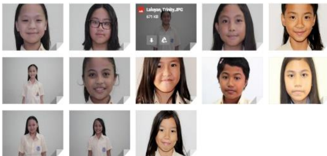
Kelompok Choir 7-8

Para siswa kelompok siswa Choir 7 - 8 (foto di bawah) yang memiliki kemampuan musik berkategori tinggi di Manado Internasional School. Dalam pembelajaran musik virtual, khususnya pada materi Paduan Suara, praktik pengambilan nada dan latihan vokal dilakukan oleh setiap siswa. Sebelumnya, mereka telah ditentukan jenis suaranya dalam kelompok alto, bass, dan sebagainya. Pembelajaran secara virtual ini semakin menjadikan siswa merasa percaya diri dan berani untuk tampil, demikian karena proses interaksi hanya siswa sendiri yang ada di tempat, tanpa bersama siswa-siswa lainnya.