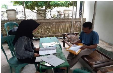
Gambar 1 Koordinasi dengan Ketua UPR Mitra Mina Sejahtera

survei ke lokasi mitra disajikan pada Gambar 1.