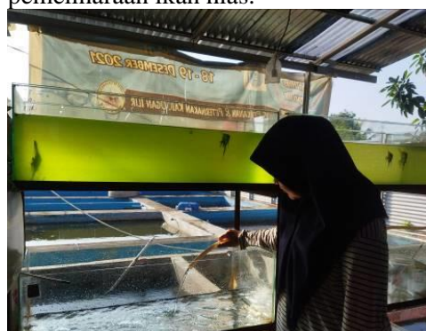
Gambar 11 Pemeliharaan Ikan Hias pada Kegiatan Pendampingan

teknis yaitu mahasiswa sebagai kegiatan Praktik Lapangan. Menurut Setyaningrum et al. , (2020) menyebutkan bahwa praktik lapangan merupakan salah satu cara yang dapat dilakukan untuk menerapkan hasil pengetahuan dan pengenalan dari kegiatan yang telah dilakukan sehingga diharapkan tercapainya proses transfer teknologi. Kegiatan pendampingan ini dilakukan selama 30-60 hari (Gambar 11). Evaluasi keberhasilan pada tahapan kegiatan pendampingan dilakukan dengan pengukur parameter reproduksi, pertumbuhan, dan kualitas air pada pemeliharaan ikan hias.