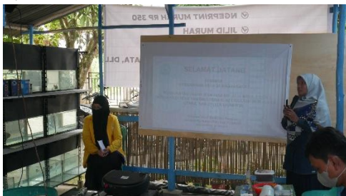
Gambar 3 Penyampaian Materi

Sebelum dilakukan penyampaian materi, pembudidaya diminta untuk mengisi kuesioner ( pre-test ) yang bertujuan untuk mengetahui pemahaman awal pembudidaya tentang manajemen budidaya ikan hias. Begitu juga setelah penyampaian materi dan pelatihan, pembudidaya juga diminta mengisi kuesioner yang sama ( post-test ) untuk mengetahui pemahaman pembudidaya setelah dilakukannya kegiatan sosialisasi dan pelatihan. Wardani dan Andika (2021) menyatakan bahwa untuk mengevaluasi pemahaman dan kemampuan peserta pelatihan dilakukan dengan memberikan tes sebelum dan sesudah kegiatan pelatihan dengan tujuan untuk mengetahui manfaat dari kegiatan pelatihan yang telah dilakukan oleh peserta. Penilaian kuesioner dilakukan berdasarkan (Yoto et al. , 2018) bahwa dengan menggunakan skor penilaian skala Likert yang terdiri dari skor terkecil atau kurang yaitu 1, skor sedang atau cukup yaitu 2 dan skor terbesar atau baik yaitu 3. Hasil kuesioner pre-test disajikan pada Gambar 4.