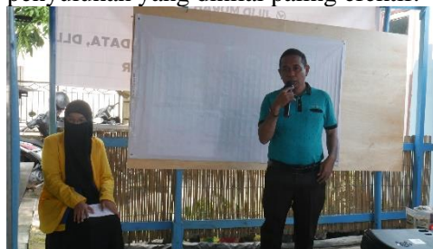
Gambar 2 Sambutan dari Kepala Desa Tanjung Pering

inovasi teknologi sampai pada anggota jaringan sedangkan sekolah lapang, temu lapang dan demplot merupakan metode penyuluhan yang dinilai paling efektif.