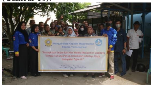
Gambar 10 Foto Bersama

Kegiatan sosialisasi dan pelatihan ini ditutup dengan penyerahan beberapa alat dan bahan dari tim PKM kepada UPR Mitra Mina Sejahtera (Gambar 9) dan dilanjutkan dengan foto bersama (Gambar 10).