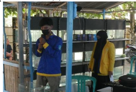
Gambar 5 Pelatihan Pembenihan Ikan Hias

menunjukkan bahwa sebanyak 85% masyarakat yang menjawab kurang, sedangkan masyarakat yang menjawab cukup sebesar 10% dan sebanyak 5% yang tingkat pemahamannya baik tentang manajemen budidaya ikan hias. Setelah dilakukan praktik pelatihan pembenihan ikan hias, pembuatan pakan ikan hias serta manajemen pengelolaan kualitas air masing-masing disajikan pada Gambar 5,6, dan 7.