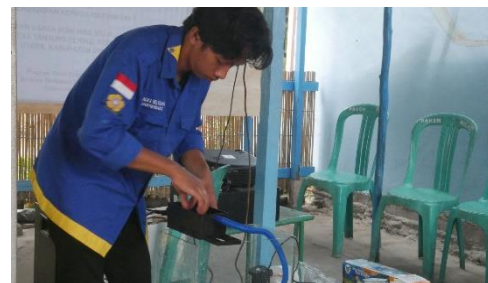
Gambar 7 Pelatihan Pengelolaan Kualitas Air Pada Pemeliharaan Ikan Hias

Setelah kegiatan pelatihan, masyarakat kembali mengisi kuesioner ( post-test ) untuk melihat tingkat pemahaman setelah kegiatan sosialisasi dan