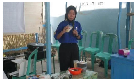
Gambar 6 Pelatihan Pembuatan Pakan Ikan Hias