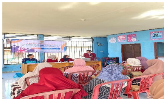
Gambar 3. Penyuluh menjawab pertanyaan warga tentang KDRT dan cara pengaduan

Pada sesi kedua yaitu sesi tanya jawab yang diikuti oleh 13 peserta, penyuluh menjelaskan tentang dampak yang ditimbulkan dari KDRT terhadap anak, cara melaporkan aduan apabila ada warga yang menjadi korban KDRT di desa serta bagaimana cara mengenali seseorang yang akan melakukan KDRT