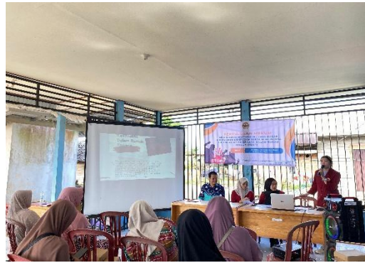
Gambar 2. Penyuluhan hukum dalam kekerasan rumah tangga

Hasil yang diperoleh dari penyuluhan didapatkan partisipan mampu memahami materi yang disampaikan dengan baik, partisipan juga mengerti akan pentingnya hukum setelah dilakukan penyuluhan, karena penyuluhan ini fokus pada pentingnya hukum jika terjadi kekerasan dalam rumah tangga diketahui juga bahwa partisipan dari penyuluhan ini lebih karena partisipan yang sudah memiliki keluarga karena partisipan dengan kriteria tersebutlah yang memerlukan nya