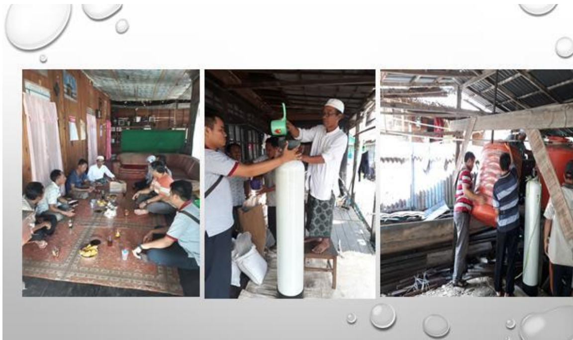
Gambar 4. Penyuluhan praktek dan Intalasi