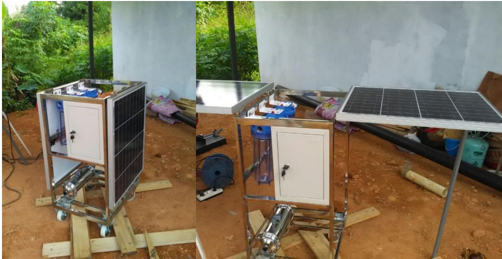
Gambar 1. Teknologi Automatic Ultrafiltration Portable

Pelaksanaan implementasi teknologi membran ultrafiltrasi (Madaeni, 1999) dilakukan dalam dua tahap. Hal ini dimaksudkan agar proses alih ilmu pengetahuan dan teknologi dari tim pengusul kepada masyarakat Desa Jambu Burung Dan Jambu Raya, Beruntung Baru, Kabupaten Banjar untuk lebih gampang dan mudah dipahami.