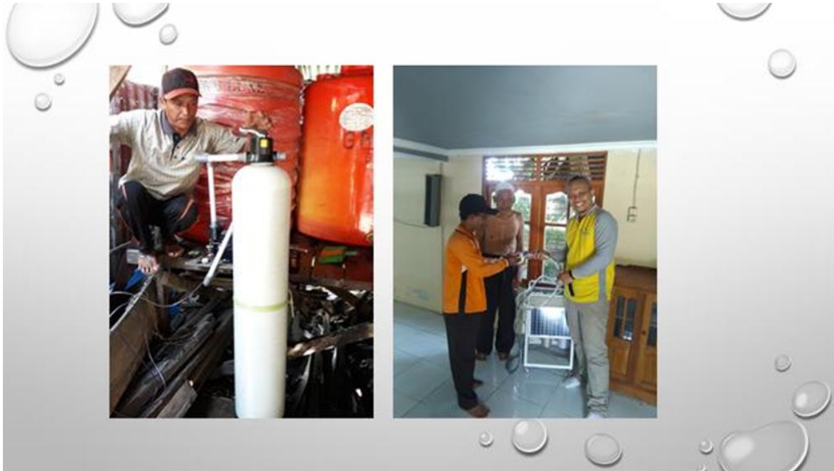
Gambar 3. Instalasi dan serah terima Peralatan