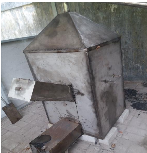
Gambar 2. Tungku produksi arang dan asap cair SMKN 3 Banjarbaru

berinisiatif menambahkan instalasi pendingin air pada kondensor. Instalasi pendingin menggunakan pipa paralon yang dirakit membentuk spiral segi empat yang dimasukkan ke dalam wadah plastic yang diisi air (Gambar 3). Penambahan instalasi pendingin ini efektif meningkatkan kondensasi asap sehingga asap cair yang diperoleh jadi banyak.