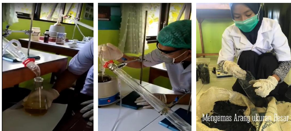
Gambar 5. Praktik Pemurnian asap cair dan pengemasan arang

Selanjutnya juga dilakukan pemisahan tar dan zat pengotor lain dalam asap cair yang diperoleh dengan metode distilasi (redistilasi) yang selama ini diajarkan dan dijadikan salah satu materi praktikum. Asap cair yang diperoleh juga dianalisis secara sederhana derajat keasamannya dengan indicator universal dan kadar asam total dengan metode titrasi (Gambar 5). Dengan demikian praktikum produksi asap cair dan arang ini merupakan praktikum tematik yang mencakup banyak muatan pembelajaran kimia dan industri sehingga keberlanjutan dan pengembangannya sangat direkomendasikan untuk proses pembelajaran di Program Studi Kimia Industri di SMKN 3 khususnya dan sekolah lain yang bersesuaian.