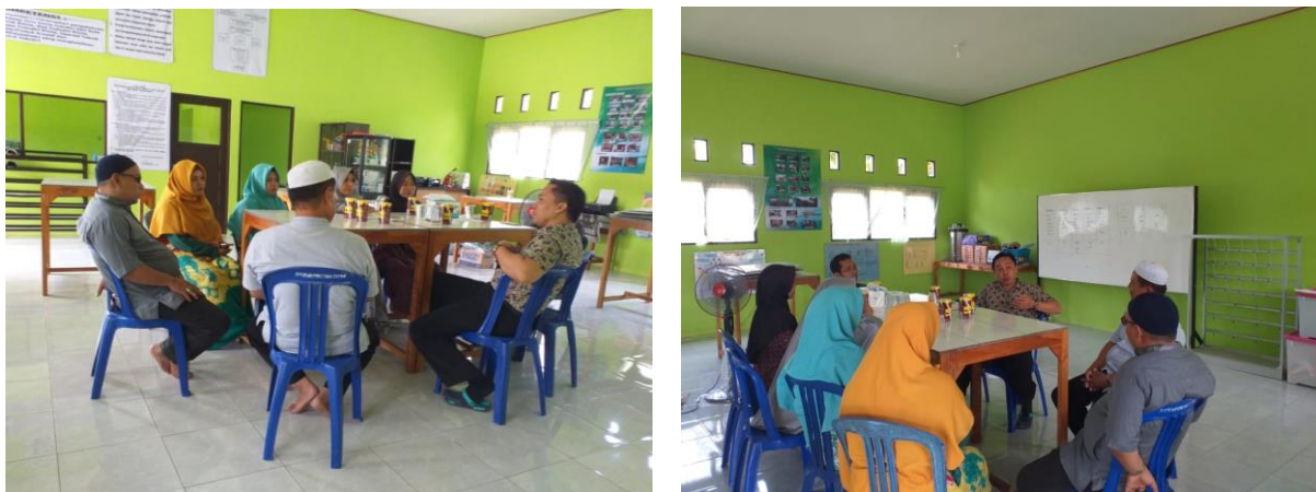
Gambar 1. Pertemuan tim pelaksana pengabdian dengan pihak sekolah (mitra) untuk merencanakan Langkah-langkah kegiatan

Kegiatan pengabdian pada masyarakat yang dilakukan oleh tim pelaksana bersama dengan mitra (pihak sekolah SMK Negeri 3 Banjarbaru) dimulai dari perencanaan kegiatan (Gambar 1), kemudian persiapan tempat produksi arang dan asap cair serta pembuatan/pemesanan tungku arang yang dilengkapi instalasi kondensasi asap sehingga dapat diperoleh asap cair, persiapan bahan baku, uji coba/praktek produksi arang dan asap cair, praktek redistilasi asap cair, karakterisasi asap cair dan penyuluhan teknik pengemasan dan pemasaran asap cair. Secara keseluruhan kegiatan berjalan lancar walaupun Sebagian besar kegiatan harus dilaksanakan secara hati-hati mengingat kegiatan ini berada pada saat mulai memasuki masa pandemic covid-19.