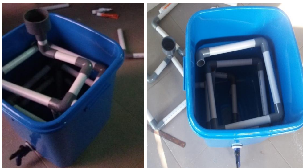
Gambar 3 Perakitan instalasi pendingin tambahan untuk proses kondensasi asap

Setelah uji coba produksi asap cair dilakukan, selanjutnya diaplikasikan untuk praktikum siswa SMKN 3 program studi Kimia Industri. Siswa secara berkelompok dan bergiliran melakukan praktikum produksi arang dan asap cair (Gambar 4). Materi praktikum ini dirasakan sangat cocok untuk memberi muatan kompetensi siswa program studi Kimia Industri. Ada banyak proses Industri dalam produksi asap cair dan arang. Proses pirolisis bahan berlignoselulosa menjadi asam karboksilat, fenolik dan senyawa karbonil dan karbon padat merupakan reaksi kimia terjadi dalam produksi asap cair dan arang.