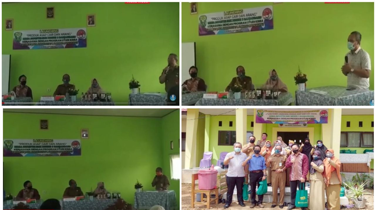
Gambar 7. Launching produk asap cair SMKN 3 dibuka secara resmi Kadis Dikbud Kalimantan Selatan

Produksi asap cair dan arang di SMKN 3 banjarbaru ini telah di launching secara resmi pada tanggal 29 September 2020 (Gambar 7) sebagai upaya promosi keberadaan unit produksi ini sekaligus promosi produk asap cair dan arang tempurung kelapa. Kegiatan launching produksi asap cair dibuka secara langsung oleh Kepala Dinas Pendidikan Kalimantan Selatan Drs. Effendy Yusuf, M.S.. Turut hadir pula perwakilan dari walikota Banjarbaru dan Pembantu Dekan II FMIPA. Kegiatan tersebut diliput dalam media massa dan diterbitkan secara online oleh Banjarmasin Post dan Kanal Kalimantan (Gambar 8).