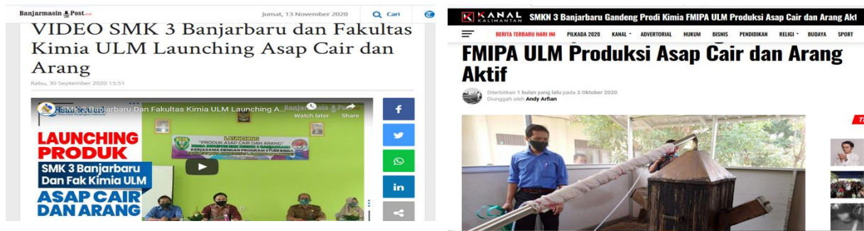
Gambar 8. Publikasi produksi asap cair SMKN 3 Banjarbaru di media massa