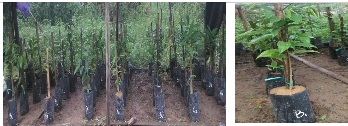
Gambar 1. Keadaan Fisik Bibit Gaharu ( Aquilaria malaccensis L)

Pengadaan bibit dengan jumlah yang cukup serta bermutu tinggi diperlukan dalam menunjang keberhasilan suatu penanaman gaharu. Peningkatan daya adaptasi antara bibit dengan lingkungan yang baru dapat distimulasi melalui perlakuan silvikultur yaitu memberi perlakuan serta melakukan pemeliharaan yang intensif (Fuzia A, et al, 2019). Berikut dibawah ini Gambar 1 memperlihatkan keadaan bibit dilapangan